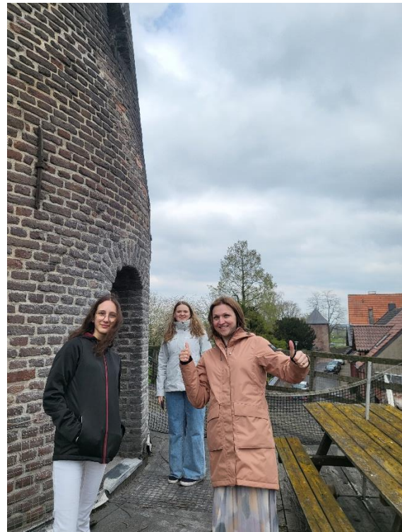
Augšā uz vējdzirnavām