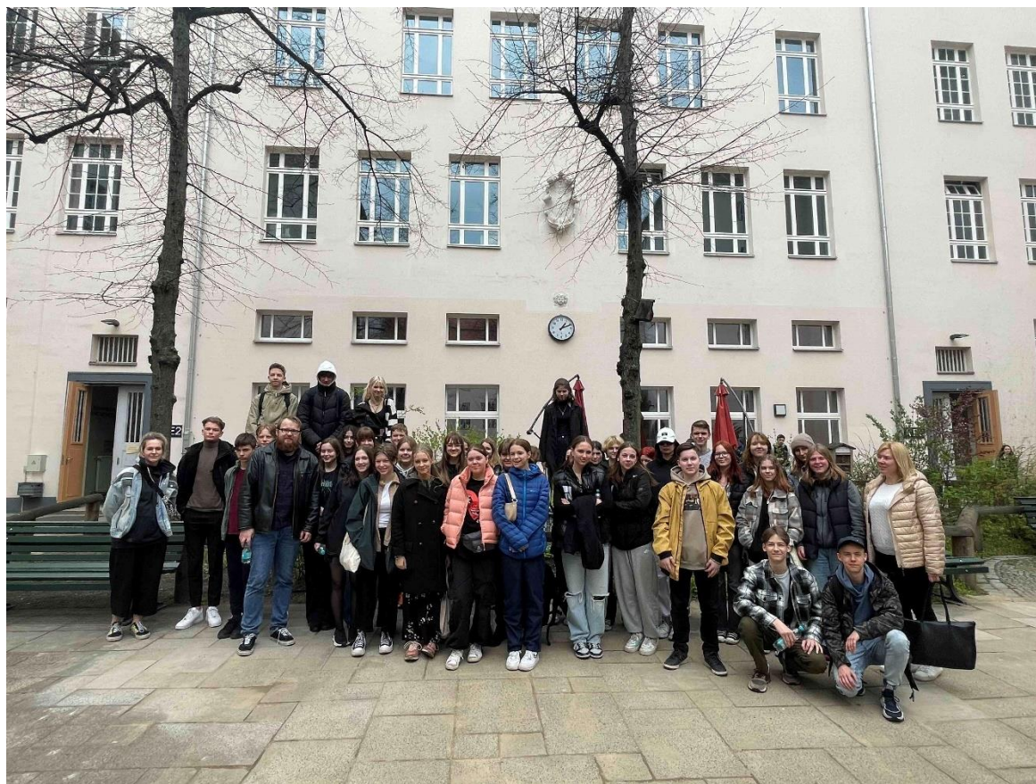
Skolēnu grupa pie Berlīnes Lessinga ģimnāzijas

Skolēni apliecina, ka projekta laikā noteikti ir iegūta vērtīga pieredze, jauni draugi un ir iepazīta cita kultūra, piemēram, kāda dalībiece secina: “Piesakoties šim projektam, es negaidīju, ka, atbraucot atpakaļ, es būšu ieguvusi tik daudz. Ja būtu iespējams, es noteikti vēlreiz dotos šādā braucienā, jo tā bija patiešām unikāla pieredze.”