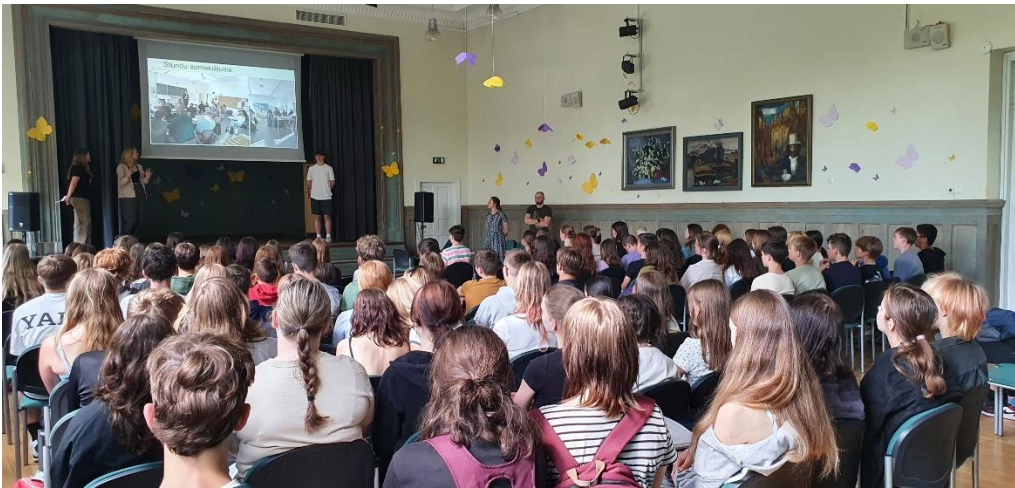
Ksantenes mobilitātes dalībnieki stāsta par stundu apmeklējumu