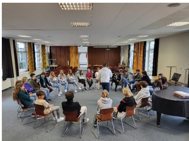
Mācību stunda - diskusija

Projekta norises laikā skolēni piedalījās ģimnāzijas mācību procesā, apskatīja Ksantenes pilsētu un rātsnamu, tikās ar pilsētas mēru, kā arī apmeklēja tuvējo pilsētu Āheni un tās elpu aizraujošo katedrāli. Vesela diena tika veltīta mācību ekskursijai uz Beļģijas galvaspilsētu Briseli, kurā skolēniem bija iespēja iepazīt vienu no Eiropas Parlamenta ēkām, kā arī apmeklēt EP sēžu zāli. Tajā pašā dienā skolēni devās uz Eiropas Parlamenta apmeklētāju centru "Parlamentarium", kas ir Eiropā lielākais parlamentārajai darbībai veltītais centrs. Tur skolēni uzzināja daudz dažādu interesantu faktu par Eiropas Savienību un ne tikai. Visa projekta laikā 11.klases skolēni grupās kopā ar Vācijas skolēniem cītīgi gatavojās projekta noslēdzošajai diskusijai par tēmu "Vācija un Latvija – kopīgās saknes un kopīgais mantojums Eiropā". Projekta noslēgumā tika aizvadīta veiksmīga diskusija. Pirms lidošanas prom skolēniem vēl bija iespēja iepazīt Ķelni un tās galveno apskates objektu – Ķelnes katedrāli. Projekta ieguvums ir starpkultūru pieredze, redzesloka paplašināšana, jauniegūtie draugi, kā arī svešvalodu, sociālo un komunikācijas prasmju pilnveide.