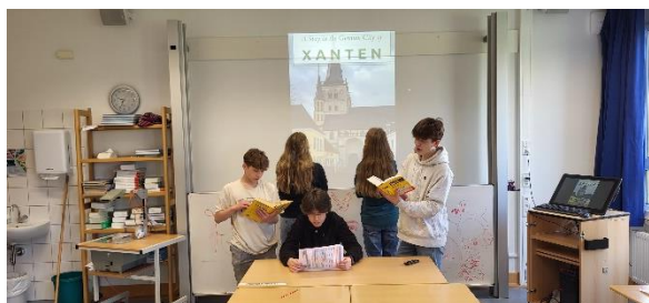
8.kl. skolēni izzina faktus par Ksanteni