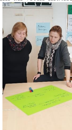
Pieredzes apmaiņa ar mācību jomu vadītājiem