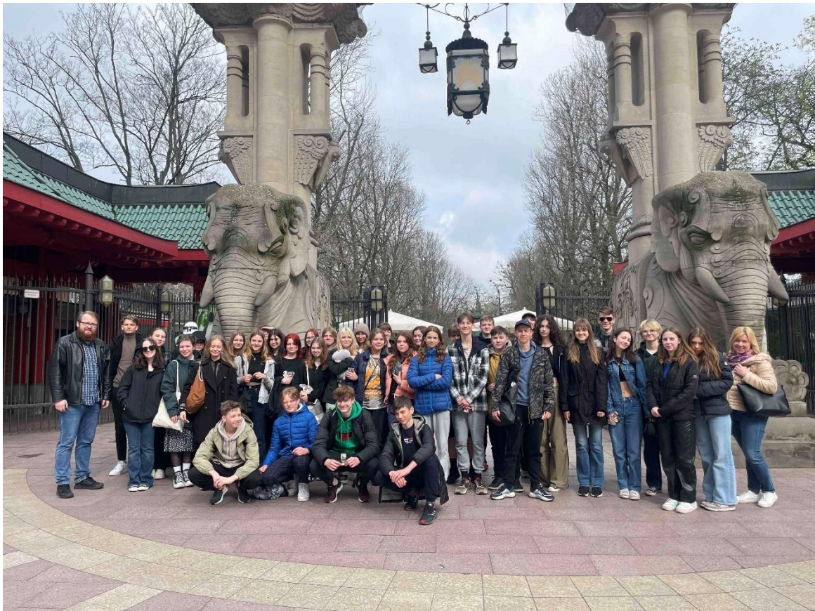
Skolēnu grupa pie Berlīnes zooloģiskā dārza ieejas