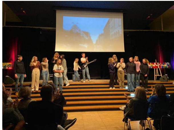
Darbnīcu rezultātu prezentēšana