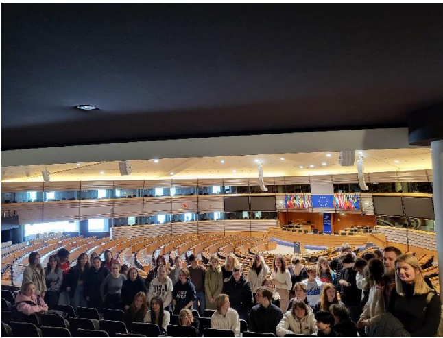
Parlamenta sēžu zālē