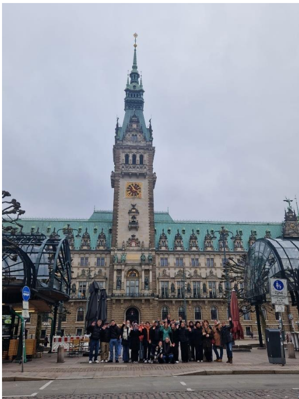
Skolēnu grupa Hamburgā