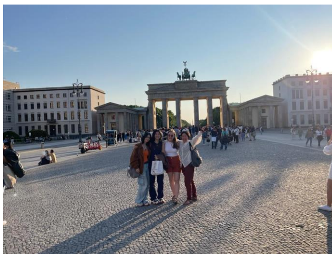
Anete kopā ar viesģimeni Berlīnē