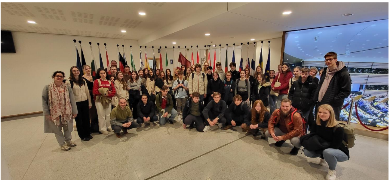
Skolēnu grupa Eiropas Parlamentā

„Ieguvu lielisku pieredzi. Ksantene ir maza, jauka pilsēta, ar kuru saistīta leģenda par varoni Zigfrīdu, par ko vairāk uzzinājām Zigfrīda muzejā.