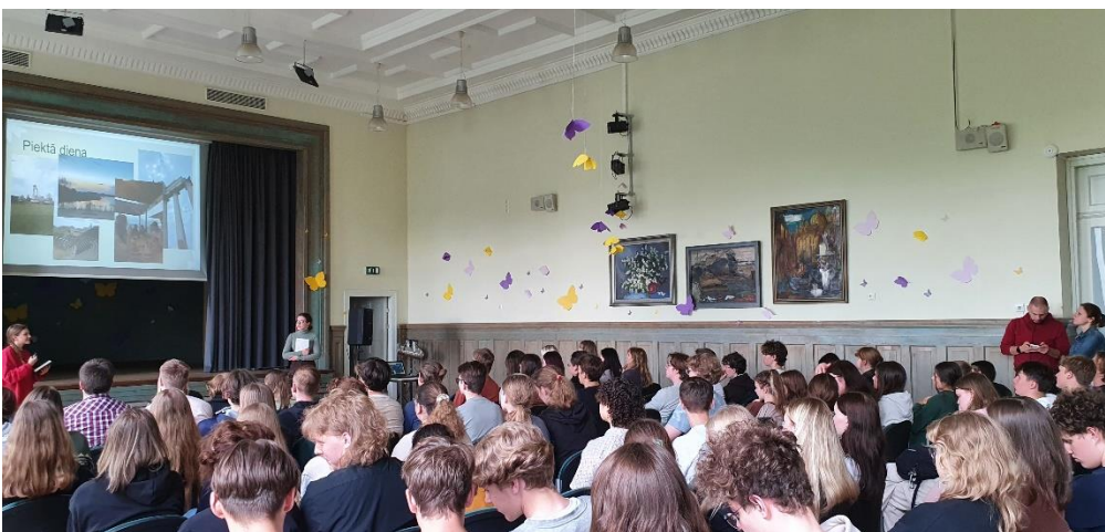
11.kl. skolnieces stāsta par savu pieredzi Ksantenes ģimnāzijā