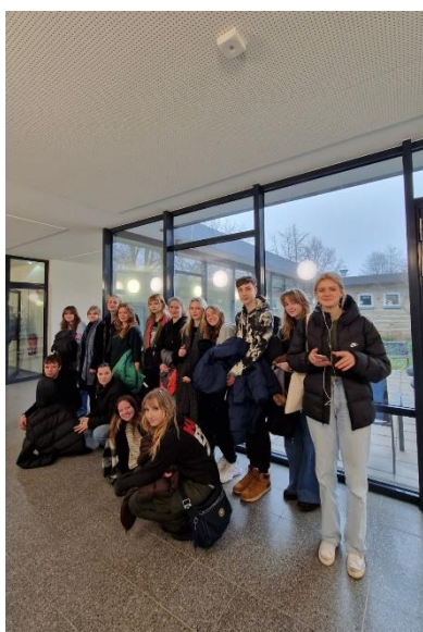
RVVG skolēnu grupa