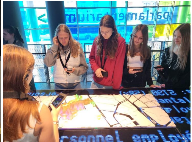
Izzinošas aktivitātes Parlamentārijā