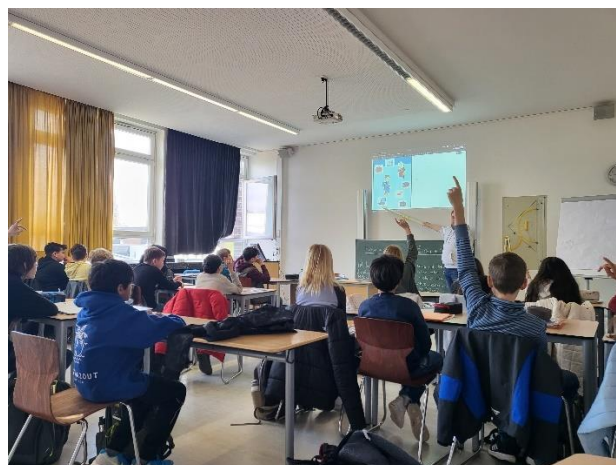
Vācu valodas stunda