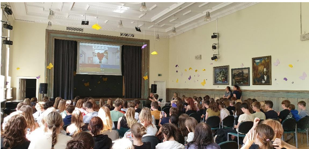
8.klases skolēni iesaista klausītājus Kahoot spēlē par dzirdēto