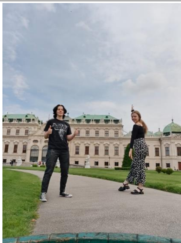
Alise un Austra pie Belvederes pils

Skola ļoti rūpējas, lai skolēniem ir iespēja izpausties, un piedāvā dažādas aktivitātes pēc stundām. Ir mūzikas telpas, kurās var mācīties klavieres, ģitāru vai citus instrumentus patstāvīgi vai ar privātskolotāju, lietot sporta telpas vai doties uz skolas baseinu. Ir arī iespējams piedalīties sporta sacensībās.