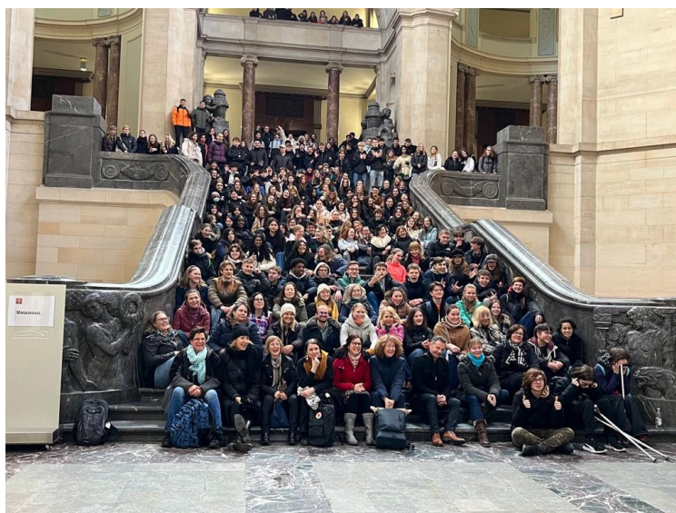
Visu valstu dalībnieki pie Hannoveres Domes

Kopā ar skolēniem no Vācijas, Nīderlandes, Zviedrijas, Spānijas, Polijas un Francijas mūsu ģimnāzisti darbojās 10 darbnīcās mākslas, mūzikas, sporta, kultūras, bioloģijas un sociālo zinātņu jomās. Viņiem bija iespēja izvēlēties savu jomu, jo katrā darbnīcā bija jāveic cits uzdevums. Viena grupa dokumentēja nedēļas norisi un veidoja video, savukārt cita grupa diskutēja par to, ko nozīmē dzīvot, mācīties un strādāt citā valstī, kādi ir plusi un mīnusi. Mākslas darbnīcā tika veidots kopīgs mākslas darbs, bet bioloģijas darbnīcā - bišu māja. Kādas grupas uzmanības lokā bija arī tēma Ūdens un ūdens deficīts dažādās valstīs . Muzikālajiem jauniešiem bija iespēja darboties mūzikas darbnīcā, izveidojot grupu un atskaņojot 3 populāras dziesmas savā aranžējumā, savukārt citā darbnīcā tika radīta dejas horeogrāfija. Jauniešiem bija iespēja iepazīt sporta veidus un tos salīdzināt, kā arī sadarboties komandās un iepazīt dažus no tiem. Projekta noslēgumā tika prezentēti darba rezultāti.