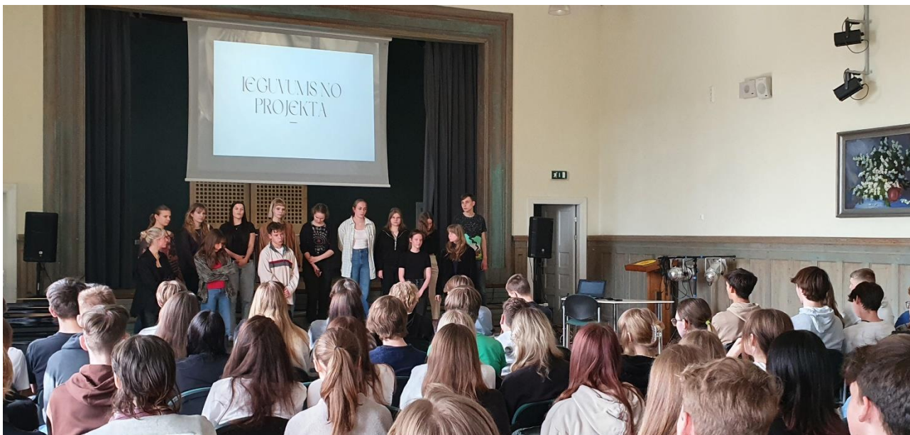
Hannoveres mobilitātes dalībnieki stāsta par projekta ieguvumiem