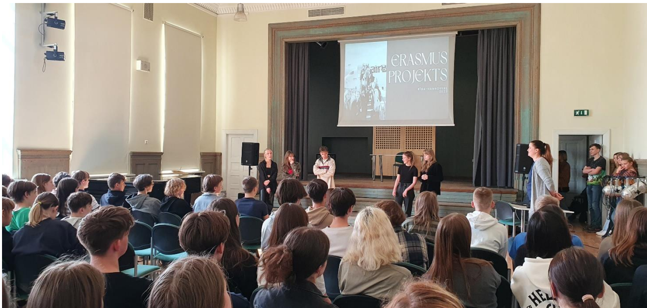
Skolēni iepazīstina klausītājus par Erasmus+ projekta mērķiem un iespējām

Projekta dalībnieki dalās projektā iegūtajā pieredzē un stāsta par projekta norisi un aktivitātēm 7., 9. un 10.klašu skolēniem ģimnāzijas aktu zālē. Sava stāstījuma vizualizēšanai skolēni izmantoja prezentāciju un video. Ksantenes projekta 8.kl.skolēnu grupa bija sagatavojusi arī Kahoot , lai aktivizētu komunikāciju un paplašinātu skolēnu redzesloku.