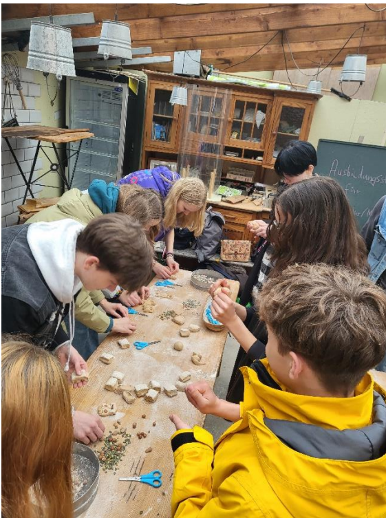
Ceptuvē apgūst maizes cepšanas prasmes