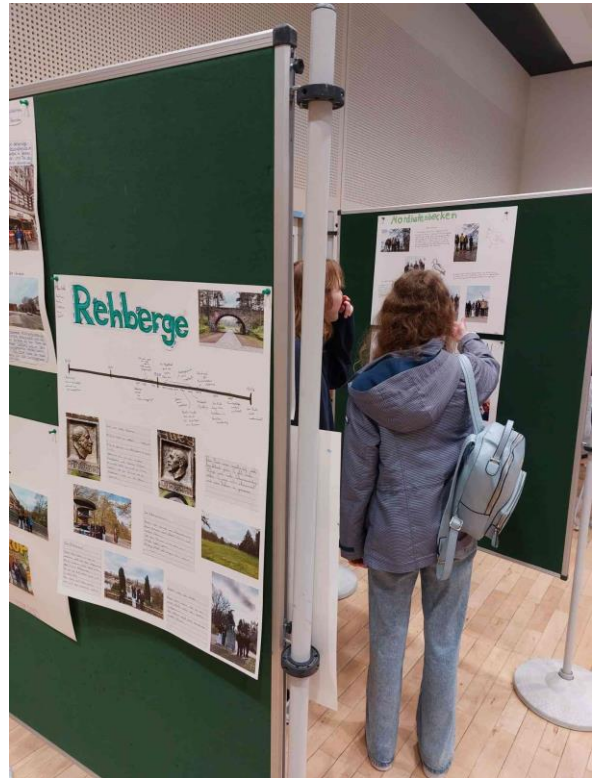
Darba rezultāti – plakāti par apskates objektiem