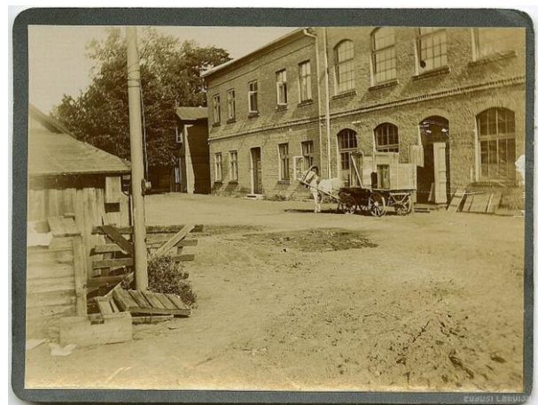
Netālu no Dārtas ielas