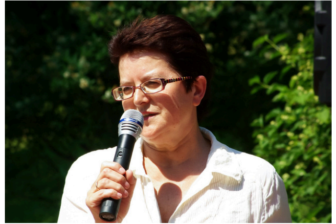
Dzejniece un dramaturģe Māra Zālīte 2011.gadā

Katrai klasei tika nosūtīta anonīma aptauja, un tika ievākta 121 atbilde. Pašreiz šķiet, ka skolēnu sirdis ir iekarojusi 11.CS klase, kura jau trīs iepriekš rīkotajos pasākumos ir ieguvusi pirmo vietu. Nākamā prognozēs ir 11. CV klase, tai seko 11. EU un 11.EI klase. Savukārt starp desmitajām klasēm par favorītu tika uzskatīta 10.CS klase, kas turpina 11.CS atstāto mantojumu un jau ir ieguvusi pirmo vietu Tēvzemes nedēļas pasākumā. 10. klašu kategorijā