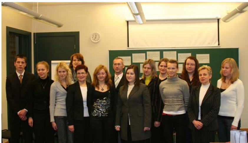
Foto: Godalgoto darbu autori viesojas KNAB un tiekas ar žūrijas pārstāvjiem.

Konkursa uzdevums bija ne tikai kritizēt, bet pats galvenais – formulēt skaidrus pamatnoteikumus, kas būtu obligāti jāievēro visiem valsts pārvaldē strādājošajiem.